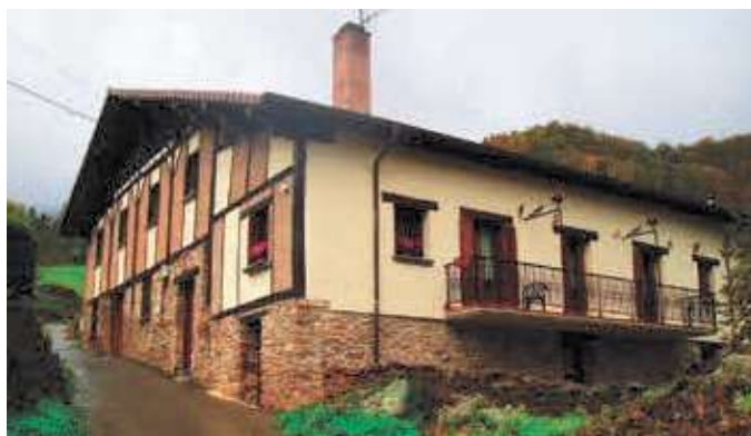
Salbarredi baserria 1987an eta gaur egun, azken berritze lanak egin ondoren.